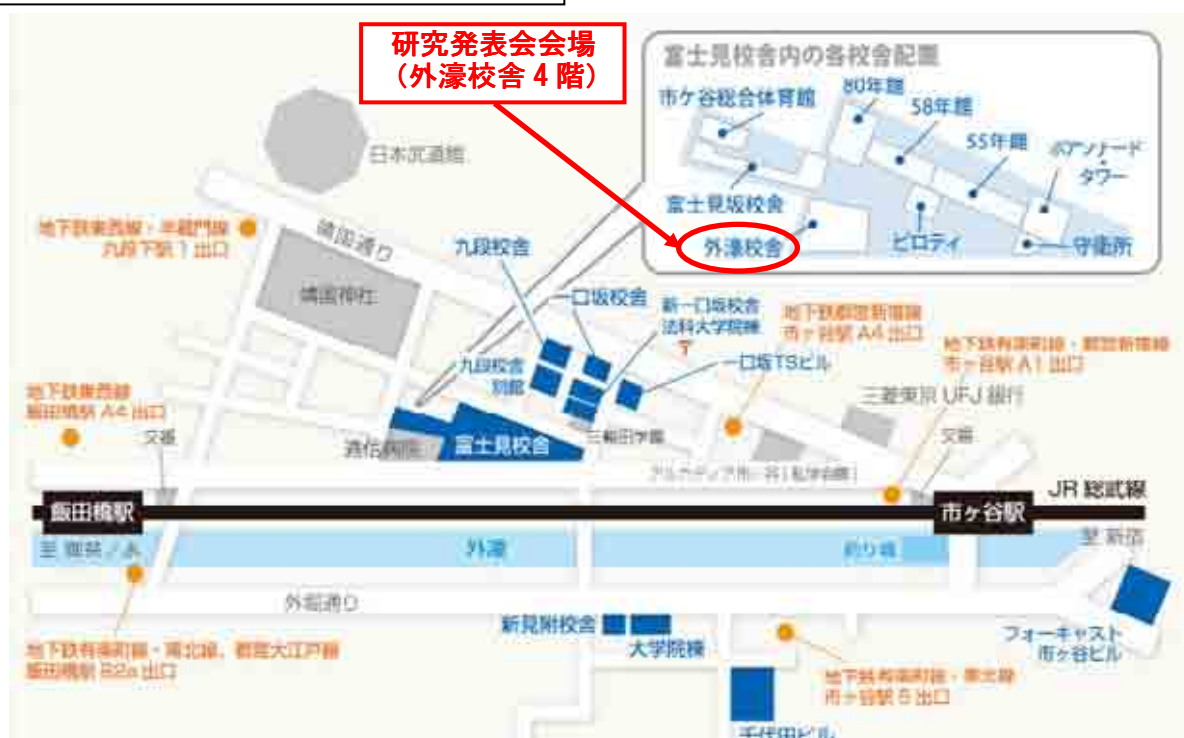
市ヶ谷キャンパス会場案内図

エクスカージョン 清水建設㈱技術研究所（東京都江東区越中島3-4-17） 詳細は次頁。